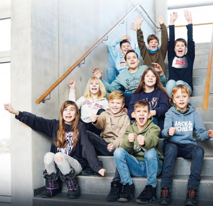
Schüler der Friedrich-Boysen-Realschule Altensteig und Teilnehmer bei Jugend forscht

Weil uns dieser Einsatz begeistert, unterstützen wir Jugend forscht im Nordschwarzwald. Seit 2008.